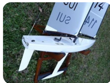
Exemple: IOM Plan B d'Australie, le bateau navigue sur le lac de Zurich

Les bateaux ont été testés lors de championnats et sont à la pointe de la technologie. Le succès ne dépend que du capitaine. Au cours des premières navigations sur le lac, il apprend le pilotage, les réglages et la tactiques avec ses collègues.