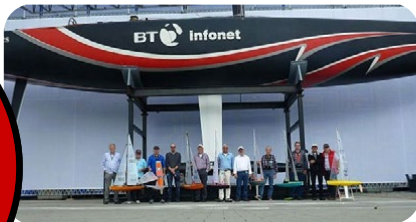
Au Musée des transports de Lucerne, les participants du Championnat suisse 2014, devant Alinghi

Le MYCS est là pour vous, mais savez-vous vraiment ce qu'il fait ?